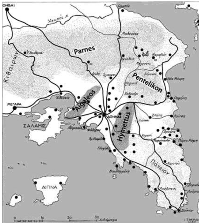
Fig. 1 : Carte de l'Attique pendant les temps préhistoriques (Travlos 1993)

satisfaisant, pour autant qu'ils exercent proprement leur imagination et permettent non seulement à leurs corps de suivre les chemins et les traces préparées pour eux par les archéologues, mais à leurs esprits et à leurs âmes d'être tout autant impliqués. Amédée Ozenfant offre une excellente description d'une expérience de cette sorte après une visite de Delphes : « Je n'étais pas un spectateur passif... par mes mouvements, qui modifiaient les rapports des bâtiments et des objets proches ou lointains, je dotais la vue avec les mouvements... Lorsque je m'arrêtais, ils retombaient dans la sérénité, qui est une situation d'attente, non une fin » 25 .